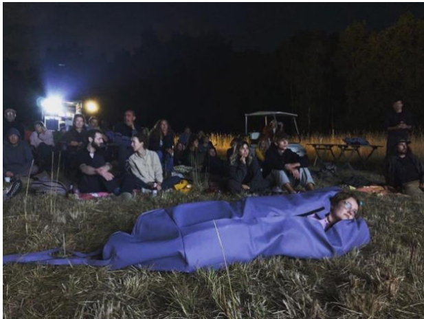
Bio-scoop op Landgoed Grootstal en op boerderij Bodemzicht.

Op 7 september organiseerde we samen met stichting Bodemzicht en met DeepEndFilm Nijmegen en stichting In Goede Aarde een bioscoop in het veld van Bodemzicht voor betrokkenen bij het programma Bodemleven . De avond bestond uit het beamen van bodemsamples om het microbeleven te kunnen waarnemen, een film van een wetenschapper van de Winnemem Wintu tribe en een selectie korte films gecureerd door Mathieu Janssen van DeepEndFilm.