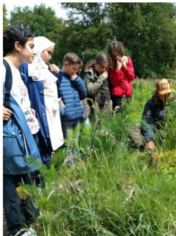
Kinderen van de weekendschool @

Op 29 mei 2022 bezoekt ICM Weekendschool Nijmegen het programma Bodemleven . Ruim dertig kinderen komen op zondag naar de boerderij onder meer te leren over regenereren, ecosystemen en te zien dat een boerderij verschillende vormen kan hebben. Na evaluatie wordt besloten om dit idee de komende jaren te herhalen. Inmiddels werken we aan een gezamenlijk document voor fondswerving, zodat we de kwaliteit van de eerste ontmoeting kunnen blijven waarborgen in de nabije toekomst.