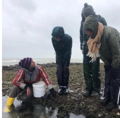
Platform DIS bezoekt, samen met het artieteke team Verstrengheld Wildwier en de eerste zeewierboerderij in Nederland, beiden bij Neeltje Jans.