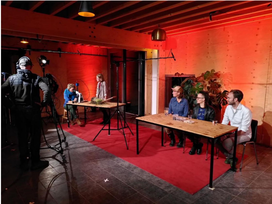
Beeld van de live-opnames van Bodem in-zicht van 3 november.

tegelijkertijd raakt de huidige vorm van landbouw overal aan haar grenzen: in stikstofuitstoot, biodiversiteitsverlies, degradatie van waterkwaliteit en het uitstoten van broeikasgassen. Het meten van de waarde van landbouw heeft het proces van standaardisatie en opschaling opgevolgd. Bodemleven belicht deze werkwijze kritisch, omdat standaardisatie niet passend is bij de diversiteit van landschappen en alle organismen die daarin leven. Waar we naar op zoek gaan is concrete interactie in de bodem tussen microben, fungi, mineralen, bodemdierpjes, water en dergelijke. Voor het onderzoeken van interactie tussen organismen zijn nog geen tools voorhanden.