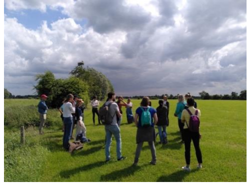
Excursie met Living Lab door Rosa Boone